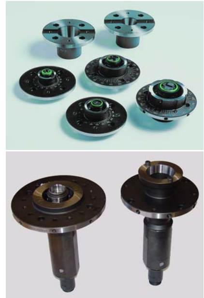
Werkzeugaufnahmeadapter, manuell (oben) und automatisch (unten)