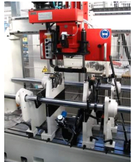
Bohreinrichtung mit Späneabsaugung