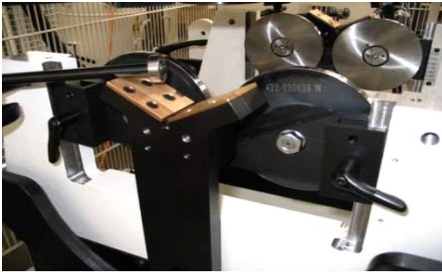
Messrollen und Ausheber